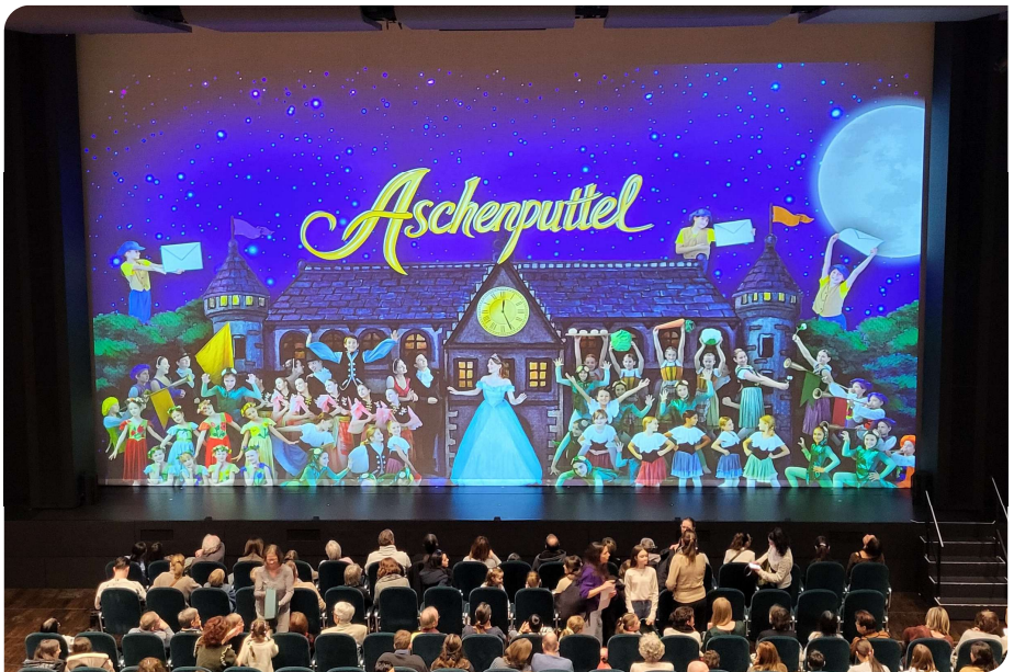
La salle se remplit avant le début du spectacle

C'était pour moi la première fois que j'assistais à un spectacle de cette troupe et j'ai été surpris par la qualité de l'ensemble : les décors, la musique et les différentes scènes qui se sont succédé sans anicroches. Tout était d'un très haut niveau.