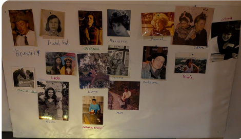
Les photos identifiées

d'identité. Il avait apporté pour l'occasion un drapeau vaudois.