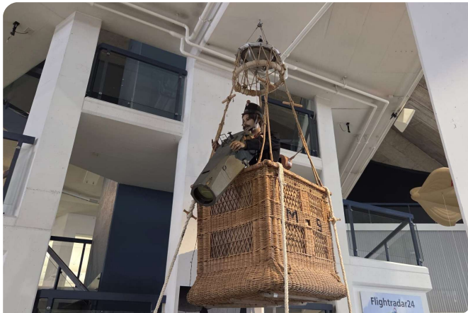
Un militaire photographiant avec une caméra « Zeiss »

nombreuses applications sur les avions les plus modernes gérant les divers systèmes de guerres électroniques, a su nous expliquer les diverses phases du développement de l'aéronautique au cours du siècle précédent. Des montgolfières en passant de la troisième dimension par les militaires avec ces ballons retenus par des cordes pour observer les alentours en le photographiant à l'aide de caméras « Zeiss » particulièrement sophistiquées pour l'époque à l'arrivée d'avions particulièrement adaptés aux missions à accomplir, nous avons découvert l'ingéniosité de nos prédécesseurs. C'était le temps des aéroliers avec leur « saucisson fédéral » tirés par des hommes qui photographiaient les plaines environnantes et fournissaient de nombreuses informations aux officiers chargés de déterminer la stratégie à adopter.