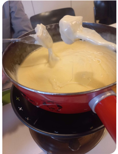
La fondue, excellente !

Dans la salle, les convives prennent place, d'étranges boîtes font surface (salade, pommes de terre...) avec le temps de nouvelles pratiques complètent ce moment solennel. Les caquelons arrivent, un morceau de pain se met à tournailler dans le délicieux fromage et c'est parti !