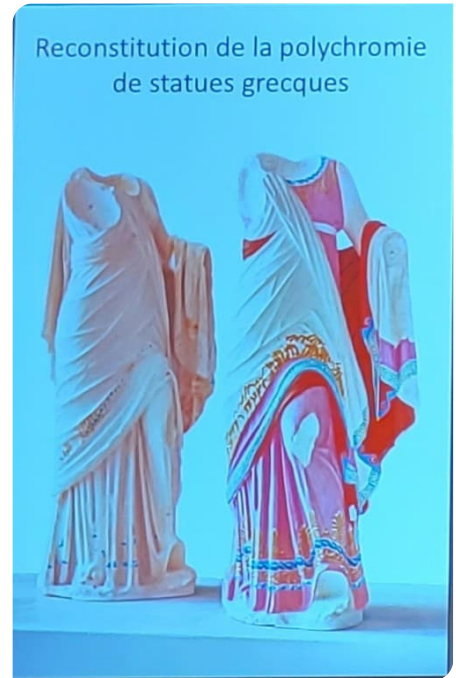
Statue colorée d'après les recherches

mythologie grecque sont d'origine étrangère comme la princesse Europe qui était phénicienne et d'autres d'Asie Mineure.