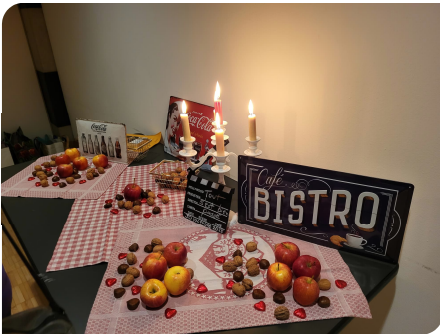
Ambiance sympathique pour la soirée