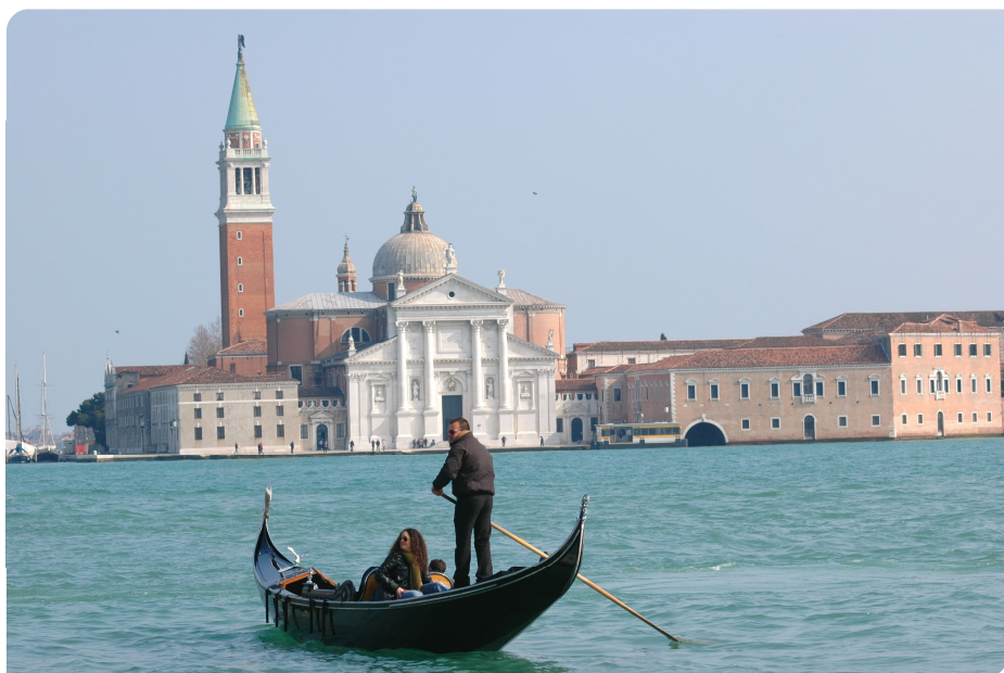
Le charme et la beauté de Venise parcourus en gondole

La conférence commence par l'arrivée à la gare Santa Lucia la vision sur la lagune et les îles avoisinantes, ainsi que l'eau qui est omniprésente et fascine à la fois. Ensuite, nous avons quelques informations sur la fondation de Venise qui est estimée au 25 mars 421.