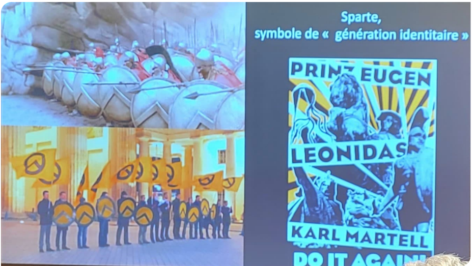
Les symboles des soldats spartiates repris par des groupes identitaires

Molôn labé, ΜΟΛΩΝ ΛΑΒΕ). Tous les combattants furent finalement tués, mais cela reste comme un symbole de courage. Cette inscription grecque se retrouve aujourd'hui sur des T-shirts de suprémacistes américains. Le modèle spartiate n'a donc pas fonctionné et la représentation que l'on en a est un mythe.