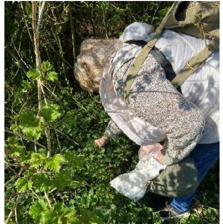
Viviane la téméraire et les orties !

Le pissenlit qui renforce les reins et le foie, est riche en vitamine C, potassium et sélénium. Un détoxifiant naturel et décoratif que l'on a mis sur notre pain !