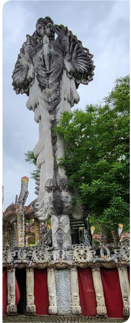
L'imposant Owl Man

Il réalisa également des œuvres pour des commandes comme pour l'« Owl Man » (l'homme-hibou) de la bibliothèque de l'université de Vienne, une sculpture de 19 mètres de hauteur et de 190 tonnes. Une copie est visible dans le parc, mais elle est en polyester pour en réduire le poids.