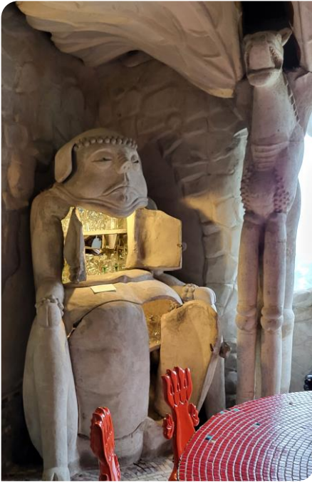
Le buffet à verres à côté du dragon ailé

eux-mêmes se fondent dans le délire des idées mythiques et irrationnelles de l'artiste.