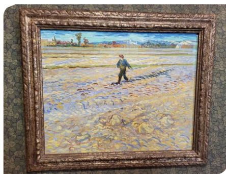
Le semeur (Van Gogh 1888)