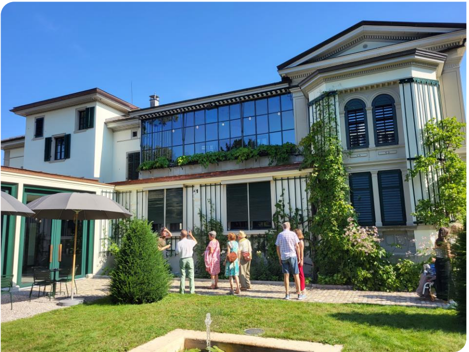
La villa Flora vue du jardin sous un ciel azur

Nous ne pouvons que vous recommander de visiter les différents musées d'art de Winterthur qui réunissent une pléthore de chefs-d'œuvre dans notre ville et on se réjouira d'autant plus lorsque le musée Oskar Reinhart « am Stadtgarten » sera rouvert après la rénovation en cours.