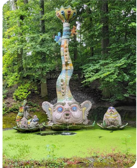
Fontaine dans le parc

Une partie de la maison d'habitation se visite également et on se rend compte que l'ameublement intérieur est également du même style et que les meubles sont des animaux ou des personnages transformés.