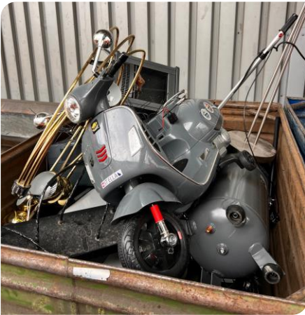
Avant triage : Tout en vrac

Derrière cette description plutôt simple et banale se cachent des procédés complexes en série, allant de démontages manuels à des processus mécaniques et chimiques perfectionnés de haute technologie.