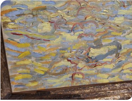
Le semez, enchevêtrement des couleurs

Nous passons ensuite dans la chambre verte qui fut jadis un petit salon et ensuite une cuisine, et qui présente actuellement des œuvres de Toulouse-Lautrec et de Van Gogh. Deux tableaux de ce dernier qui montrent l'évolution de son travail avec « La place des voitures » de 1881 et « Le café de nuit à Arles » de 1888.