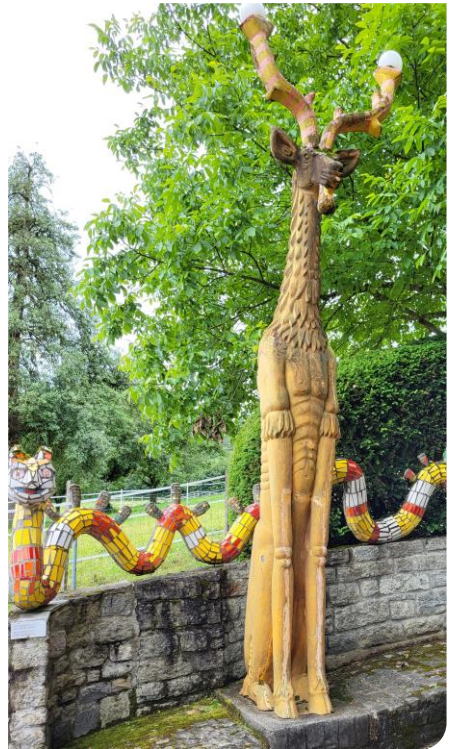
La première impression lors de l'arrivée

Weber (décédé en 2011 à 80 ans) qui accueille généralement les groupes de visiteurs.