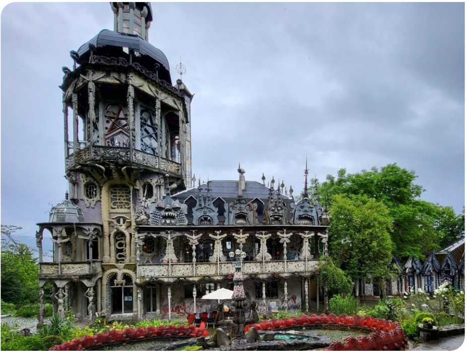
La maison d'habitation avec ses sculptures mythologiques

Une sortie idéale avec des enfants avides d'aventures imaginaires et aux plus grands restés ouverts à la fantaisie improbable de Bruno Weber.