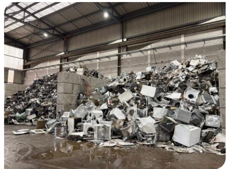
Après un premier triage : machines à laver

J'ai réalisé qu'IMMARK faisait partie de toute une « industrie » du recyclage. IMMARK occupe certes une fonction centrale dans cette « industrie », mais il y a en amont beaucoup d'entreprises qui récoltent les déchets des consommateurs (par exemple « Maag Recycling » à Winterthur) et également de petits ateliers de démontage qui cherchent à récupérer des éléments qui sont encore en état de fonctionnement. La chaîne continue aussi en aval : il y a des entreprises qui préparent et purifient les matériaux séparés par IMMARK pour les réintégrer dans de nouveaux produits.