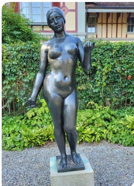
Statue d'Aristide Mayol dans le jardin

œuvres à demeure, de sorte que la collection comporte des tableaux du couple et de leurs enfants peints par les artistes dans la maison même ou dans le jardin. On y voit d'ailleurs dans l'escalier menant aux premières salles du musée « La villa Flora » peinte en 1912 par Henri Manguin.