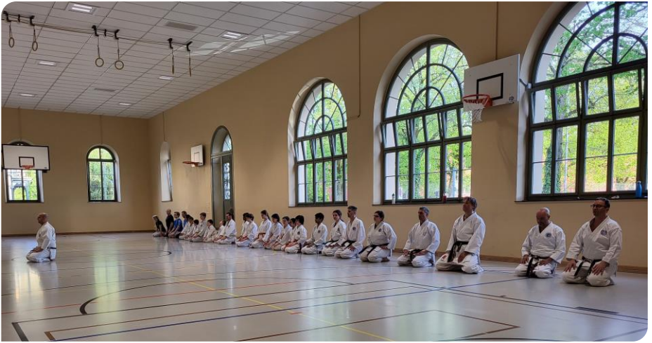
Salutation au sensei à la fin de l'entraînement, les membres du CRW tout à gauche.

qui sont censés représenter un combat contre un ou plusieurs adversaires. Comme ils le font tous ensemble, cela ressemble à une chorégraphie, mais lorsqu'ils laissent sortir leur cri en chœur, on comprend leur détermination à se défendre.