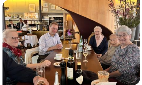
La deuxième partie des participants

Comme chaque année je remercie le comité pour l'apéro du repas de chasse et répete que celles et ceux qui désirent se joindre au groupe seront chaleureusement accueillis. Seule condition, en plus de celle de prendre la bonne humeur avec soi, consulter l'agenda ou me téléphoner pour connaître le lieu de la rencontre qui a toujours lieu le dernier vendredi du mois, sauf en décembre.