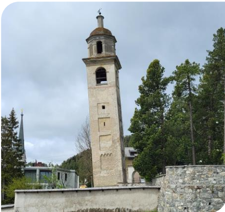
La tour penchée de St-Moritz

Nous sommes donc retournés la voir et en ayant un autre angle de vue, nous avons bien constaté que nous avons aussi une tour de Pise en Suisse.