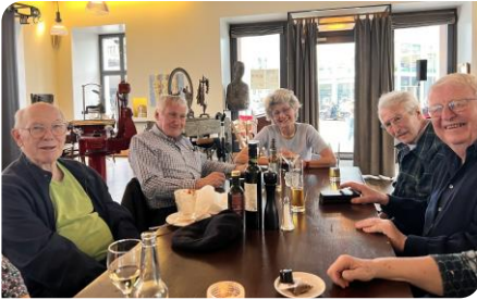
Une partie de la tablée

Comme à chaque Assemblée générale depuis plus d'une décennie je vous raconte qu'une dizaine d'aînés se rencontrent l'après-midi du dernier vendredi de chaque mois dans le restaurant de leur choix. 2023 fut conforme à la tradition.