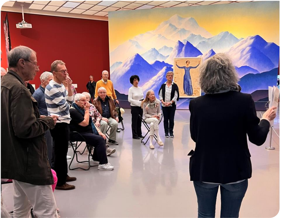
Les membres du CRW attentifs aux explications de la guide