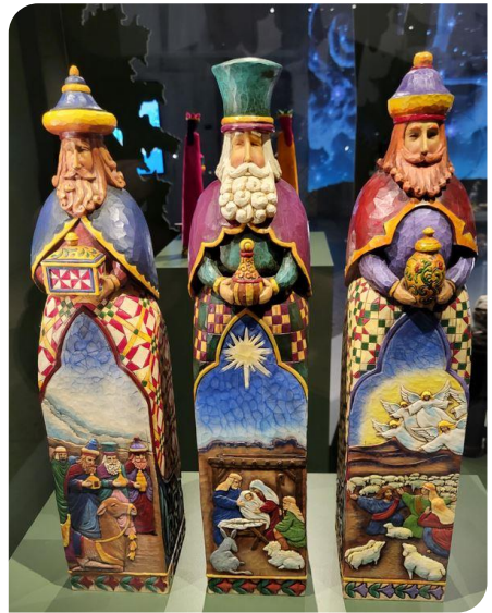
« Un joli emballage » pour les présents amenés par les Rois mages

Notre guide nous expliqua que le Landesmuseum a cette tradition de présenter des crèches depuis 12 ans environ. Chaque année, l'exposition est différente et le thème de cette année est « Les trois rois ». L'exposition présente 16 crèches différentes, chacune mise en valeur avec une petite décoration spécifique et une lumière adaptée derrière une vitre pour éviter toute tentation de s'emparer du « petit Jésus ».