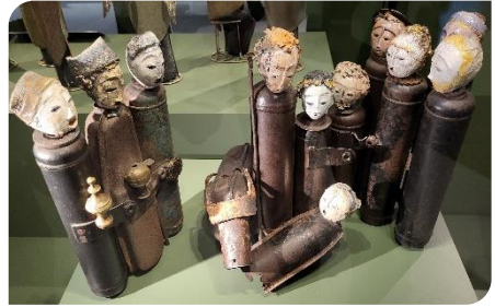
« Avec les déchets »

Evoquons encore « Fils et héritier », une sculpture en bois provenant d'Haïti et représentant la scène de manière verticale, ce qui est très original.