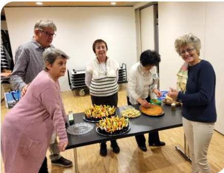
Préparation des divers plats de l'apéritif

Le samedi 13 janvier 2024 a coïncidé avec le début de la nouvelle année civile pour notre Cercle. Cette rencontre traditionnelle est généralement très appréciée et de nombreux membres y participent. C'est également l'occasion pour notre co-présidente de présenter ses vœux ainsi que les nouveaux membres.