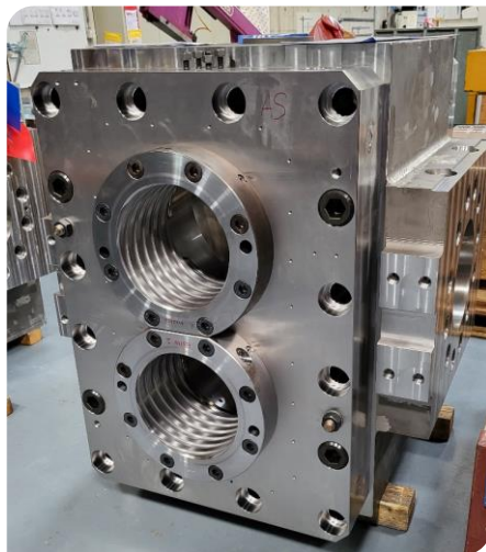
Une grande pompe en cours de montage

de la gare pour se sustenter avant de rejoindre ses pénates ! Merci à Jean-Pierre qui a su nous captiver sur le travail de son entreprise et pour la parfaite organisation.