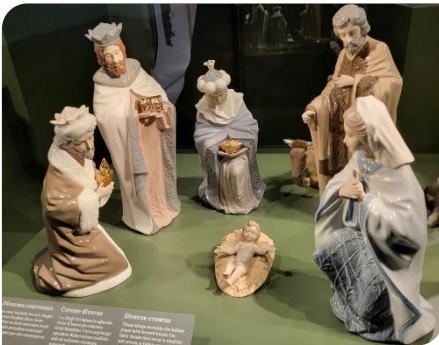
« Diverses couronnes »