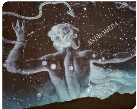
Andromède défilant dans le ciel étoilé

Citons d'autres crèches présentées : « Couronnes en tissu » d'origine mexicaine en papier collé, « Des formes claires », une représentation en bois sculpté de 1960, « Pour enfants » fait en résine époxy et feuille d'or venant du Colorado et datant de 1990 et encore « Joyeuses » avec des personnages miniatures en pâte à sel peinte d'Équateur (2009). Il n'y a malheureusement pas la place nécessaire pour inclure toutes les photos de ces très belles scènes de la Nativité.