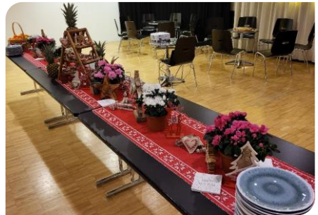
La table du buffet prête à recevoir les délicieuses préparations avant l'arrivée des convives

que de coutume. Plusieurs personnes ont donc contribué aux délices proposés cette année. Cela fut une belle réussite avec une variété de saveurs et différentes origines des plats présentés.