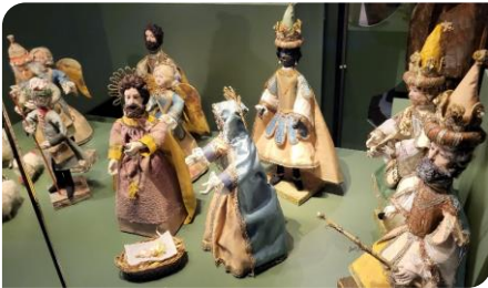
« À la maison »

Poursuivons avec « À la maison », une crèche avec Hérode datant de 1750 et construite en fil de fer, cire et tissu. Elle provient de Nesslau (canton de St-Gall) et est magnifiquement ouvragée. Seul l'enfant Jésus est simplement vêtu.