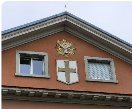
La colombe du Saint-Esprit au-dessus de la croix des Huguenots

comptait que 5'000 âmes. On imagine mal avoir une telle situation aujourd'hui.