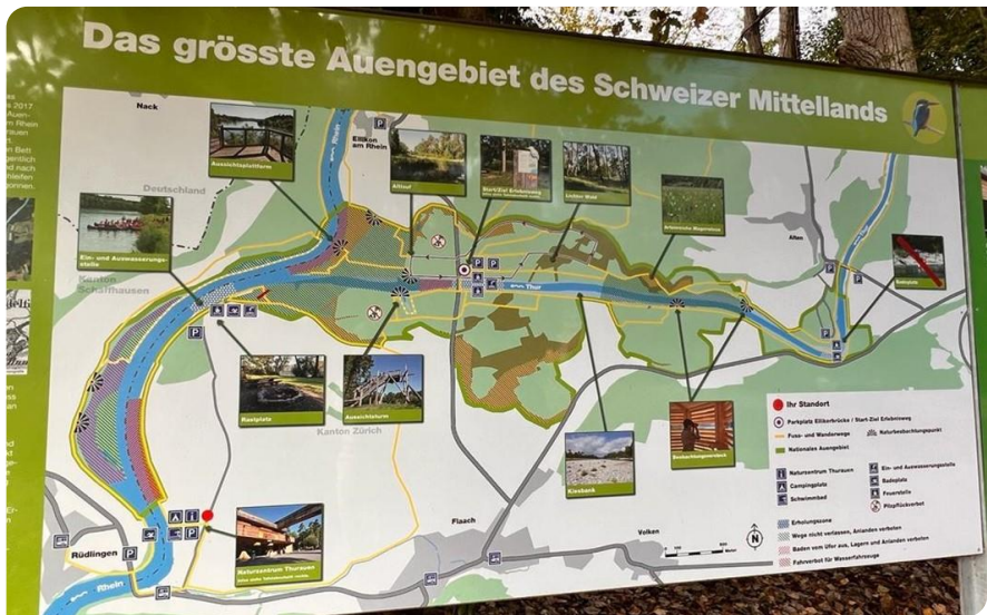
Un panneau explicatif

Donc, on démarre notre promenade le long du Rhin, le trajet se déroule dans la bonne humeur et différents échanges ont lieu entre les participants. A peine deux gouttes de pluie et le soleil revient. Nuages, soleil, nuages, le paysage s'anime avec ses lumières changeantes qui donnent tantôt des teintes grises tantôt des teintes vives et très colorées.