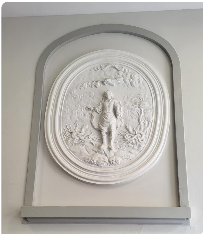
La reproduction du médaillon dans la « grosses Haus »

Cette réplique représente de manière allégorique un réfugié de France ou du Piémont marchant sous la protection de la main divine sur le chemin de l'exil et soumis aux dangers inhérents à ce type de voyage. Sur la devise au sommet de cette œuvre, il est inscrit en français : « Il faut souffrir et espérer ». La représentation rend hommage à tous ces réfugiés qui ont été pourchassés et contraints à fuir leur patrie d'origine.