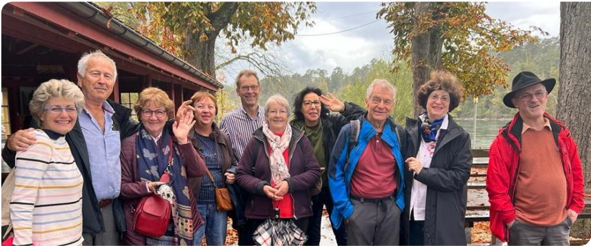
Une belle brochette de randonneurs

On se quitte enchantés de notre journée et prêts à recommencer.