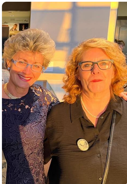
Heureuses d'être là !

une invitation de l'ambassade de France pour aller à la réception à Berne que donne Emmanuel Macron, tu y vas aussi ? » Mais oui, lorsque le président de la France te prie de venir... On y va !