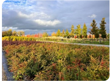
Une explosion de couleurs !

Le retour se fait sur l'autre rive du Rhin jusqu'au point de départ. La nature nous offre de nouveau des couleurs automnales d'une beauté exceptionnelle, le soleil sort d'entre les nuages en plongeant sur la campagne et la rendant pleine de couleurs et de profondeur.