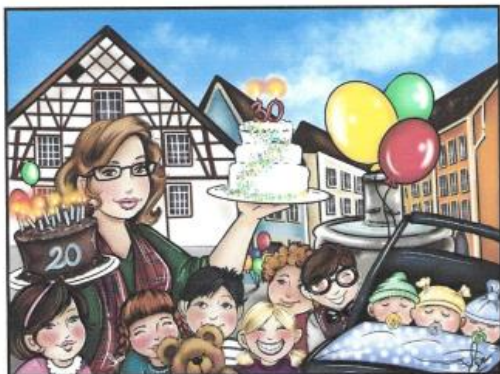
Dessin : Isabelle Desrochers, artiste peintre, Québec