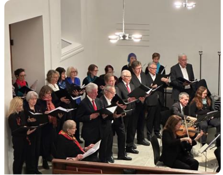
La chorale du CRW

conquis et le concrétise par des applaudissements nourris. La réussite du concert est confirmée par le large sourire du chef d'orchestre satisfait. Merci à vous tous pour ce merveilleux moment musical. Chacun se réjouit déjà du prochain » Anne-Marie H.