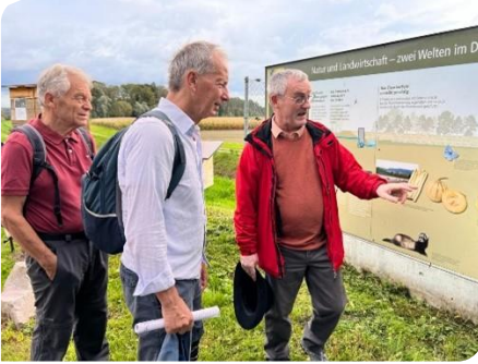
Les explications du connaisseur

Je ne donnerai pas ici le contenu de la discussion, ce n'est pas mon domaine et ce serait trop long, tout ce que je peux dire c'est que les participants ont bien apprécié.