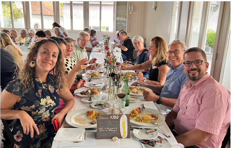
Ils ne font pas leur âge : table de la décennie 1930

1973 : première crise pétrolière. La Suisse instaure les dimanches sans voitures ! A Genève, on sort les skis de fond sur le pont du Mont-Blanc !