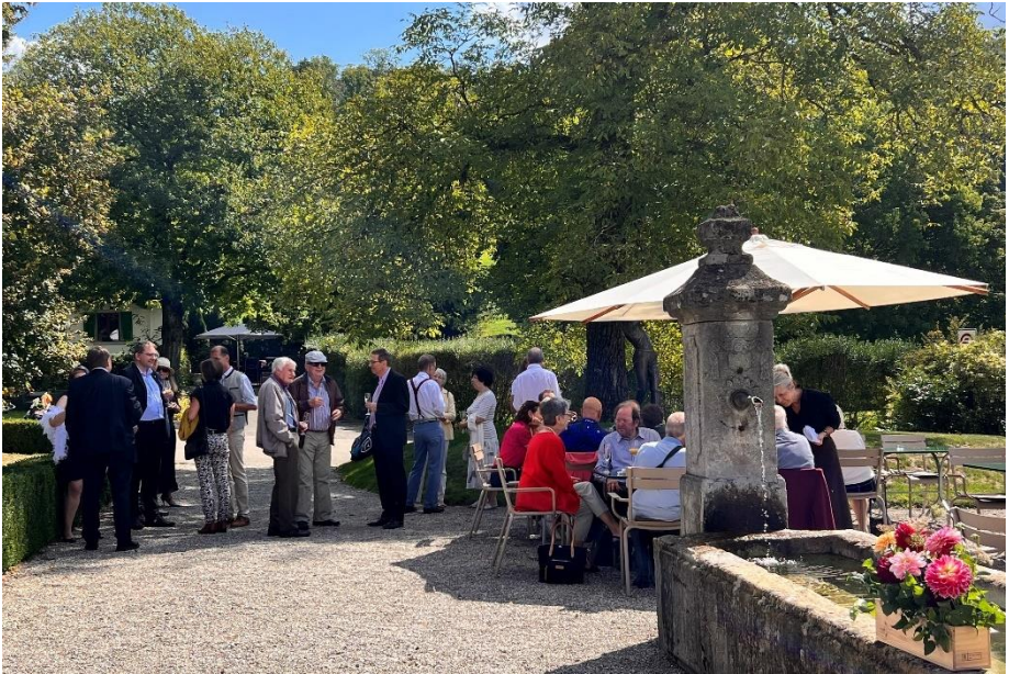
Ambiance à l'arrivée des convives