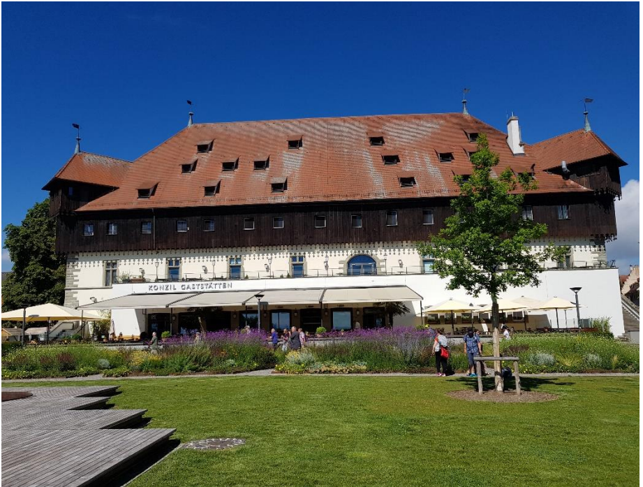
Bâtiment dans lequel le Concile de Constance eut lieu

A l'époque du Concile, les rives du lac venaient jusqu'aux murs de cet ancien entrepôt. Maintenant, les berges ont été aménagées et une belle place s'étend devant l'édifice qui est devenu un restaurant, dans lequel notre repas est prévu à la fin de la visite.