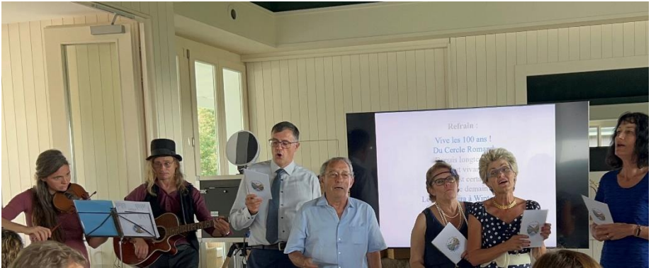
La chanson interprétée pour les 100 ans