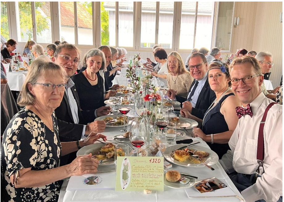
La table d'honneur - 1920

Octobre 1929 : crash boursier à Wallstreet, c'est le début de la grande dépression.