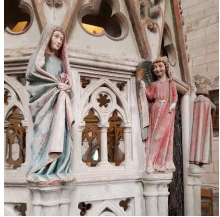
Détail de l'Annonciation sur la copie du Saint-Sépulcre dans la crypte

L'évêché a été annulé par le Pape en 1821, chose très rare, car l'évêque et le vicaire général ayant des idées trop avant-gardistes voulaient en faire une deuxième Rome. Actuellement le bâtiment est utilisé comme église épiscopale.