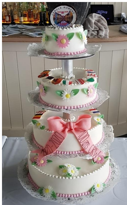
La magnifique pièce montée du dessert

Bravo et merci pour cette excellente organisation et cette belle ambiance.