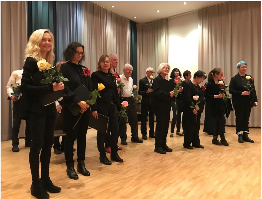
La chorale lors du concert des 40 ans