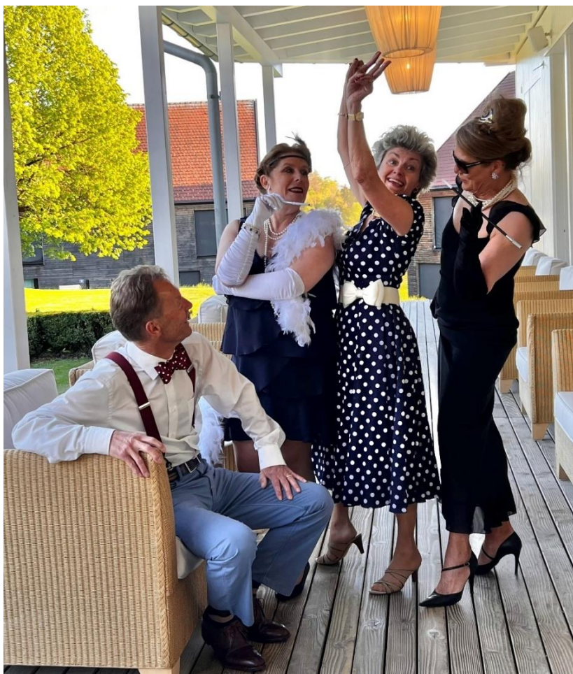
La folle ambiance des préparations

Avec deux ans de retard en raison de la pandémie, le Cercle Romand de Winterthur a fêté son centenaire le 4 septembre dernier dans le cadre charmant du Golf de Kyburg.