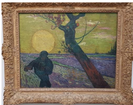
Le Semeur au soleil couchant, 1888 Vincent van Gogh (1853 - 1890)

Il faut également scruter les yeux des personnages pour constater si on y voit les