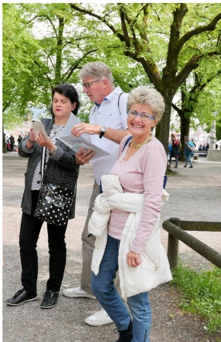
Le GO sur le Lindenhof consultant sa documentation

Poursuivant sa marche sur la rive gauche de la Limmat, notre groupe musardant du fait des nombreuses et intéressantes boutiques se trouvant sur notre chemin la traversa pour rejoindre la rive droite et gagner notre prochain but, la Spiegelgasse 14 , domicile durant la Première Guerre mondiale du célèbre révolutionnaire communiste Vladimir Ilitch Oulianov, dit Lénine. Il y a vécu de 1916 à 1917 avec sa femme, Nadia Krupskaya dans un appartement de 2 pièces.