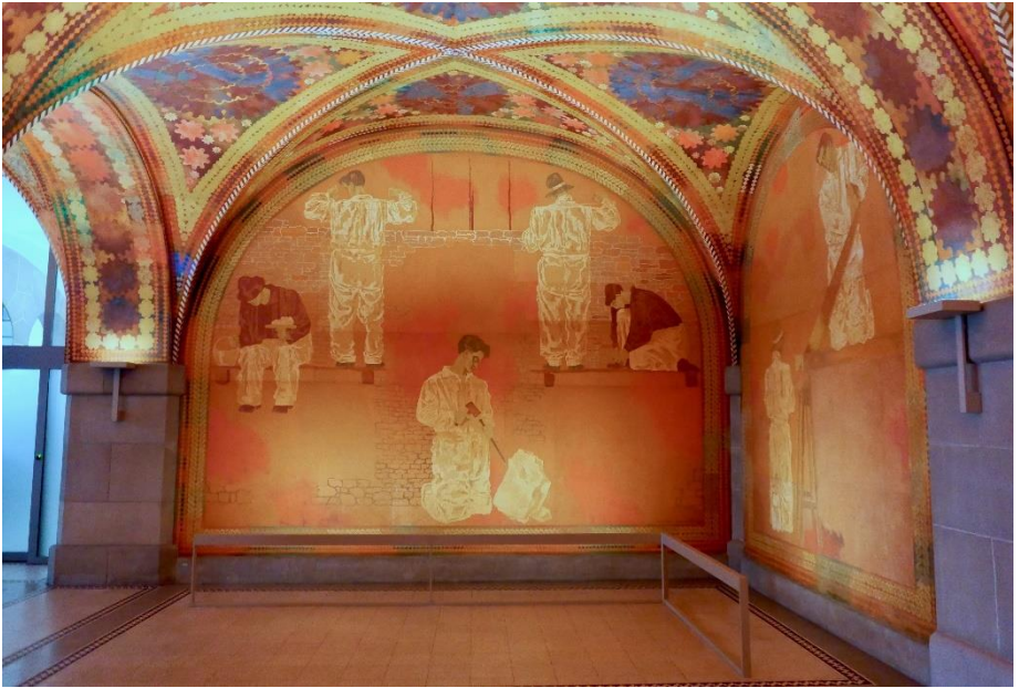
Vue d'une fresque dans la salle des petites fleurs

place aux remparts construits au début du Moyen-Age qui entouraient la ville.