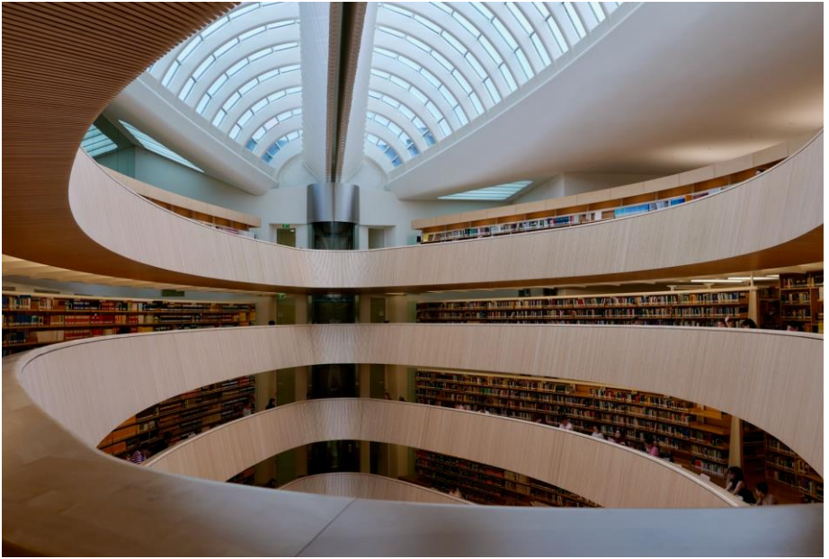
Vue impressionnante de l'avant-dernier étage de la bibliothèque de droit