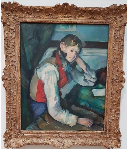
Le garçon au gilet rouge 1888-1880 Paul Cézanne (1839 – 1906)

La première œuvre qui nous est présentée est Le garçon au gilet rouge de Paul Cézanne. Notre guide nous explique que le peintre adapte le réel pour être plus expressif.